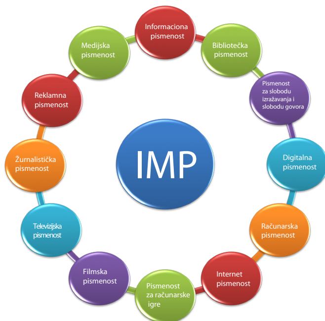
Slika 2: IMP okruženje: predstave o IMP

Namjena ovog modela Programa obuke jeste da sistemima obrazovanja nastavnika u nerazvijenim, i u zemljama u razvoju pruži okvir za izradu programa koji će proizvoditi informaciono i medijski pismene nastavnike. UNESCO takođe predviđa da će oni koji se bave obrazovanjem pregledati Nastavni program i okvir kompetencija i priključiti se kolektivnom procesu oblikovanja i obogaćivanja ovog Programa obuke, kao živog dokumenta. Zbog toga se Program obuke ograničava samo na osnovne potrebne kompetencije i vještine koje se mogu lagano uklopiti u postojeće obrazovanje nastavnika, bez prevelikog opterećivanja (već preopterećenih) studenata nastavnčkih fakulteta.